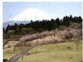
①富士山こどもの国